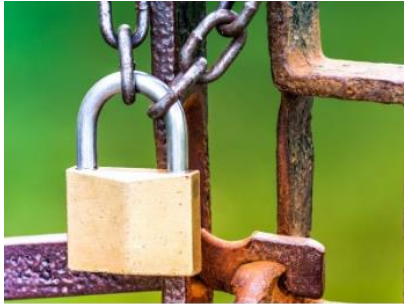
SBR Assurance 2.0

OpenSBR - open source Standard Business Reporting